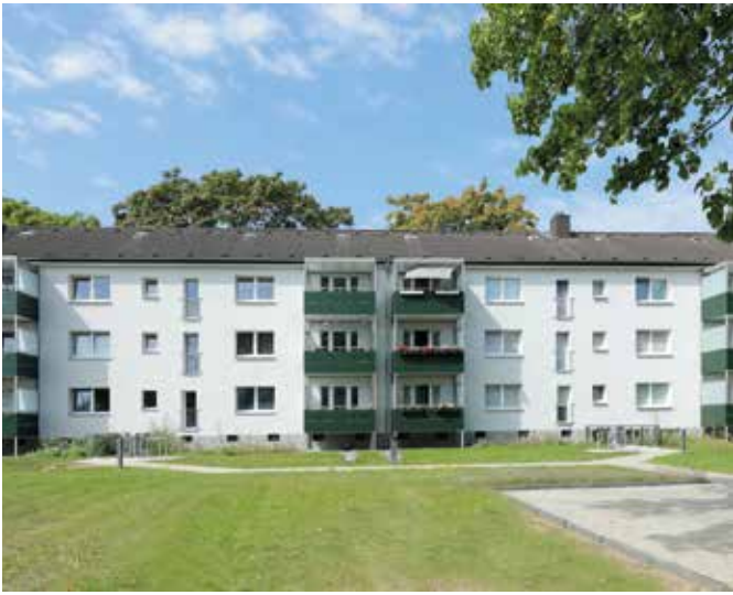
Hultschiner Str. 127 – 129