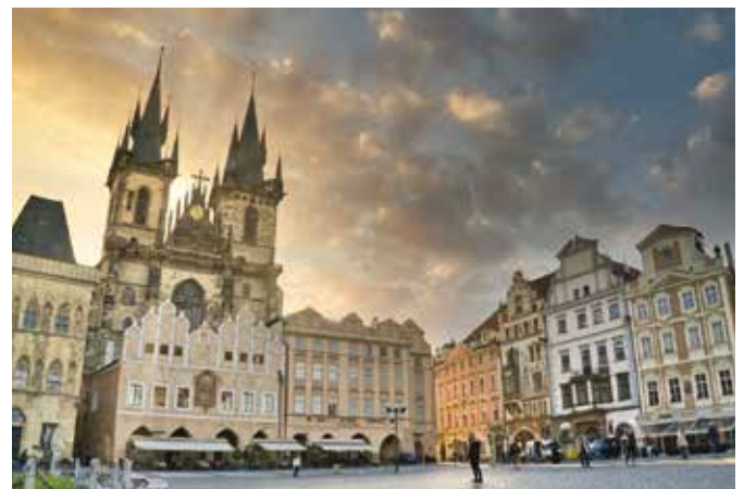
Der Altstädter Ring ist der bedeutendste Platz der Stadt aus dem 12. Jahrhundert