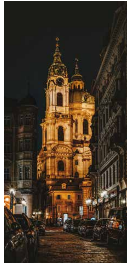
Die St.-Nikolaus-Kirche bei Nacht

Aber Prag ist nicht nur tiefsinnig, sondern auch tief schmackhaft. Kulinarisch bietet die Stadt deftige tschechische Hausmannskost – von Svičková (Rinderbraten in Sahnesoße mit Knödeln) bis hin zu rustikalem Gulasch. Und dazu? Natürlich ein frisch gezapftes Pils – Tschechien ist schließlich das Mutterland des Bieres. Wer es lieber hip als herzlich mag, findet auch dafür Raum: In Stadtteilen wie Žižkov oder Karlin floriert die Szene. Hier trifft Craft-Bier auf Vintage-Möbel, Baristas auf Basslines.