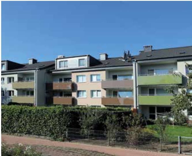
Grazer Str. 26 – 30