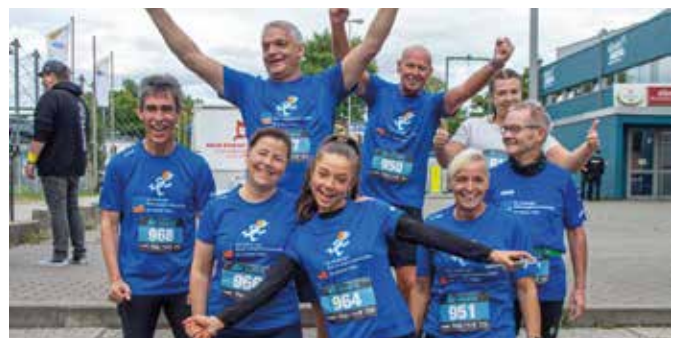
Die Stimmung im Team war ausgezeichnet.

An drei Abenden war auch WOGHEY, das Maskottchen der Duisburger Wohnungsgenossenschaften, als „laufende Figur“ auf dem Sommerkino-Gelände unterwegs und sorgte nicht nur bei den Kindern für Spaß. Neben der Unterhaltung bot WOGHEY auch Anlass für viele Gespräche mit Besucherinnen und Besuchern, in denen diese spannende Einblicke in die genossenschaftliche Arbeit erhielten und viel Wissenswertes zum Engagement der Duisburger Wohnungsgenossenschaften erfahren konnten. ●