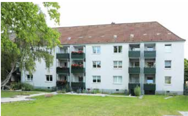
Düsseldorf Str. 554 – 558