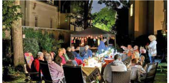
Ein schöner Ausklang eines warmen Sommertages.