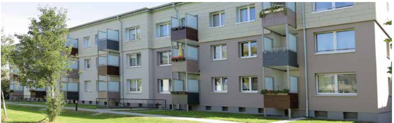
Bregenzer Str. 66 – 62