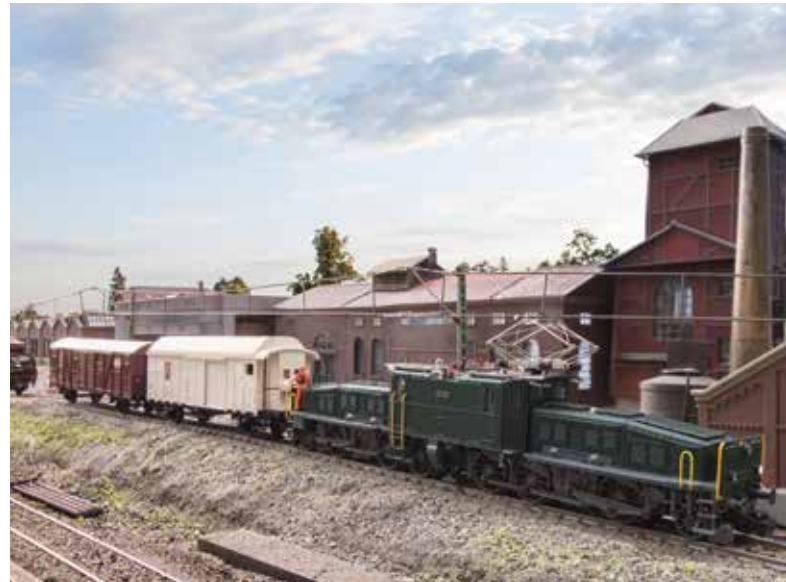
Klassiker vom Erfinder der Modelleisenbahn Märklin: Das „Krokodil“ der Schweizerischen Bundesbahnen

Das Hobby Modelleisenbahn ist konzentrierte Entschleunigung: planen, sägen, löten, programmieren, begrünen – und am Ende fährt etwas, das man selbst geschaffen hat. Die Modelleisenbahn macht Technik begreifbar (vom Dampftriebwerk bis zur E-Lok), ist Gesprächsanlass in der Familie und – dank moderner Digitalsteuerungen – so intuitiv wie nie. Und die Einstiegshürden sind niedrig: Startsets mit Zentrale, Soundlok und robusten Gleisen eröffnen binnen Minuten die erste Runde. Wer will, baut später etappenweise aus: vom Rangierbrett am Schreibtisch bis zur eigenen Keller-Topografie.