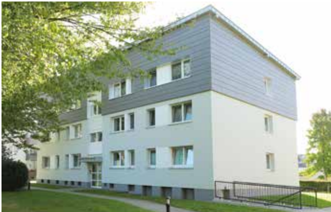
Bregenzer Str. 62 a

Ein herzliches Dankeschön gilt allen Beteiligten, die durch ihre gute Planung, handwerkliche Arbeit und Geduld während der Bauphasen mit zum gelungenen Ergebnis beigetragen haben. ●