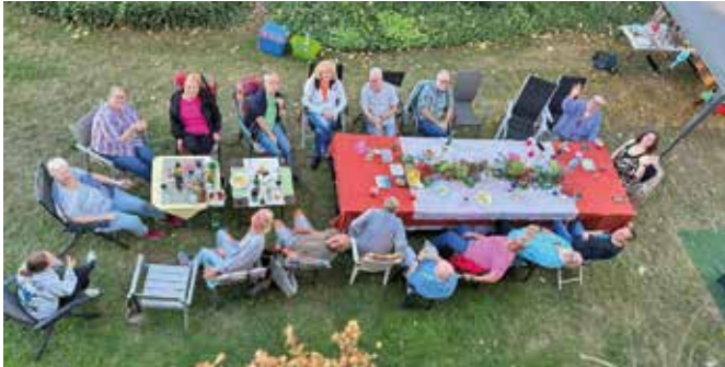
Gemeinschaft genießen – bei gutem Essen und Trinken.

mensein möglich. Jeder hat etwas zum beachtlichen Buffet beigetragen. Wir haben daher überlegt, ein solches Nachbarschaftstreffen vielleicht in größerer Runde im nächsten Jahr zu wiederholen. Wer Interesse daran hat, kann mich gerne persönlich ansprechen.“ ●