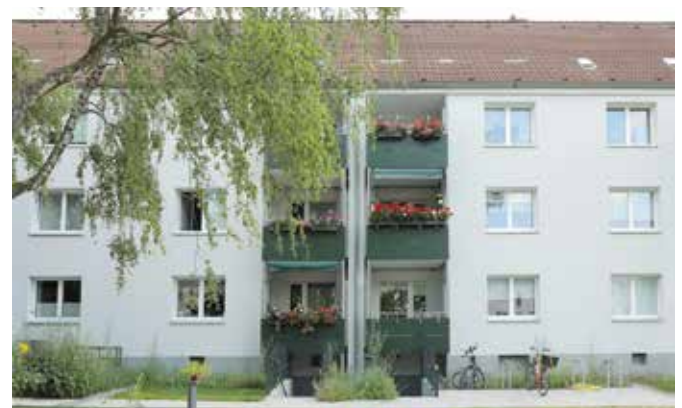
Düsseldorf Str. 556