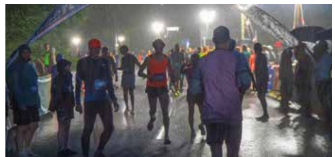
Heftiger Regen – nach einem Auftakt mit Blitz und Donner – forderte die Teilnehmer heraus.