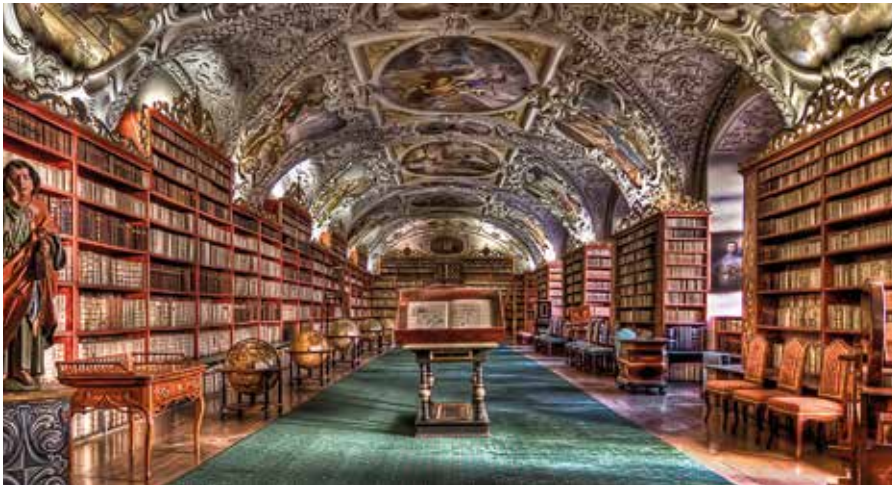
Fraglos eine der schönsten ihrer Art weltweit: die Strahov-Bibliothek im Kloster Strahov.

Im Advent zeigt die Stadt ein weiteres Gesicht: ihre Weihnachtsmärkte. Der bekannteste und größte ist der Markt auf dem Altstädter Ring – das Herz der Festzeit, mit riesigem Baum, Holzbuden, täglichem Begleitprogramm und einer Kulisse von Teynkirche und Rathausuhr, die wie für Winterpostkarten gemacht scheint. Daneben locken der Markt am Wenzelsplatz und jener am Platz der Republik, der stimmungsvolle Burgmarkt am St.-Georgs-Platz mit Blick über die Lichter der Stadt sowie – für ein lokaleres Gefühl – der Markt am Náměstí Míru in Vinohrady, der häufig als erster öffnet. Zwischen Svařák (Glühwein), gerösteten Kastanien, Lebkuchen und herzhaften Snacks wird hier geschlendert, geschaut, geplaudert – Advent, wie er sein soll.