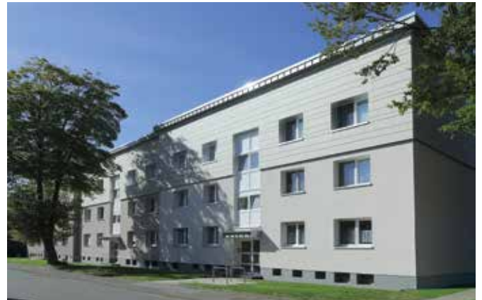
Bregenzer Str. 66 – 62