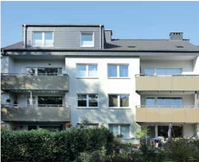
Grazer Str. 26