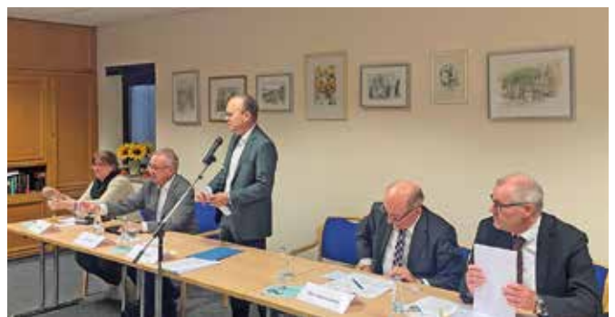
Der Vorstand bedankt sich herzlich für das Engagement und die Unterstützung aller Helferinnen und Helfer – gemeinsam gelingt Nachbarschaftshilfe am besten!