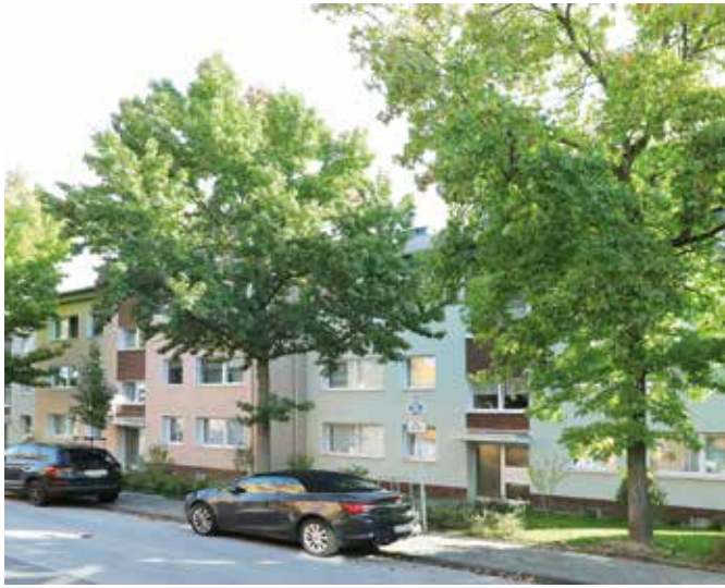
Grazer Str. 26 – 30