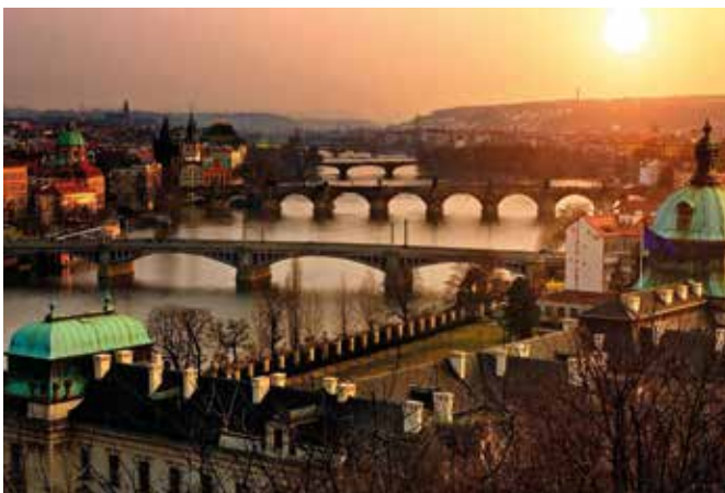
Weltbekanntes Panorama: Die Moldau mit der Karlsbrücke im Vordergrund

Melancholisch, majestätisch, manchmal ein bisschen morbide – all das ist Prag, aber dabei immer magnetisch. Es ist eine Stadt, die sich nicht aufdrängt, sondern einem langsam unter die Haut geht. Zwischen barocken Fassaden und Biergärten, Kafka-Zitaten und Kopfsteinpflaster, Moldauschimmern und Musikfestivals hat Prag etwas, das man nicht mit einem Foto einfangen kann: Charakter. Und den spürt man noch lange, wenn man längst wieder zu Hause ist.