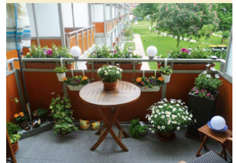
Blick vom Balkon unserer Mieterin

Dankeschön! Wir sehen dieses Lob auch als Ansporn, jeden Tag zu nutzen, damit das „Wohnen mit uns“ auch ein „gut wohnen“ bleibt.